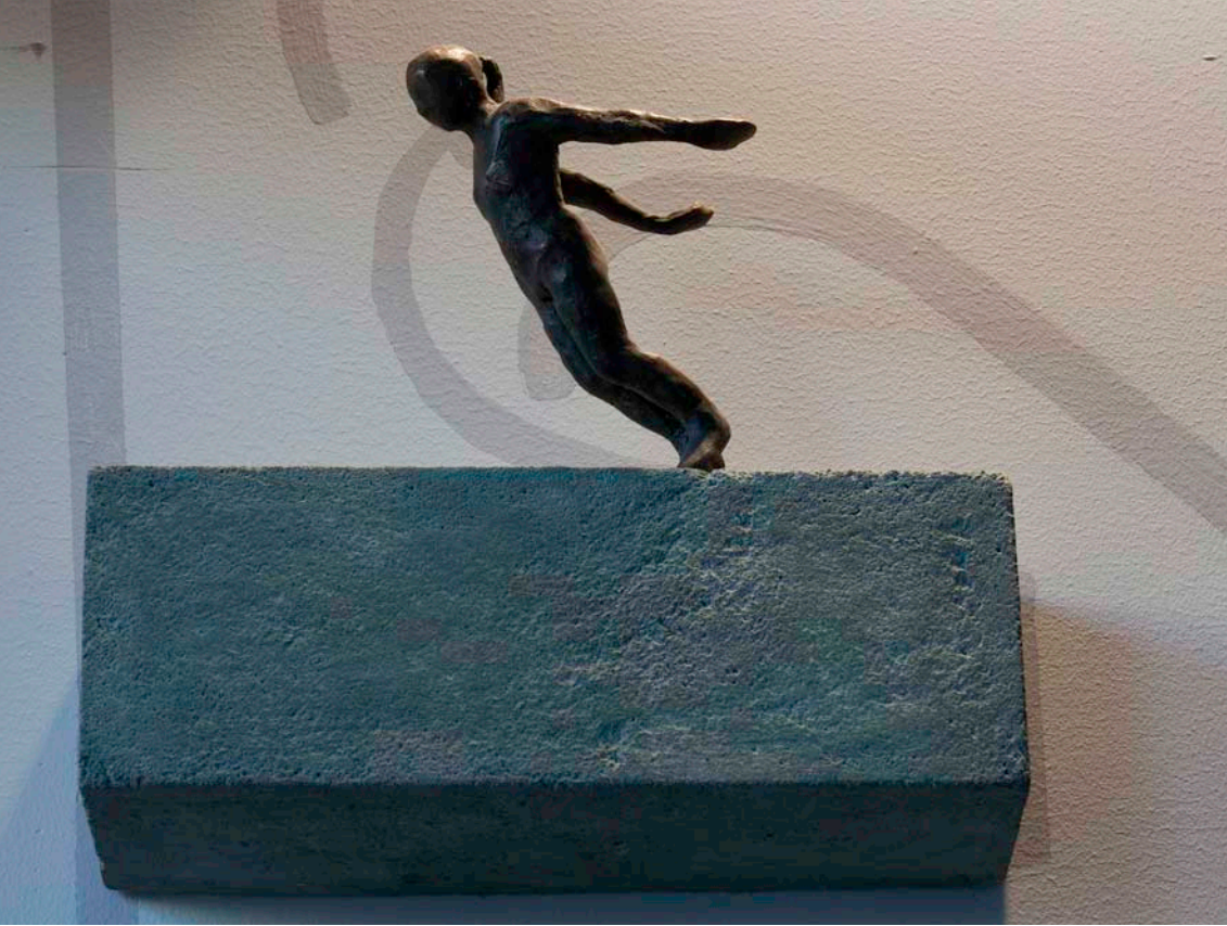
Flicka som hoppar