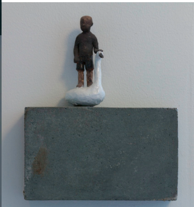
Pojke på svan